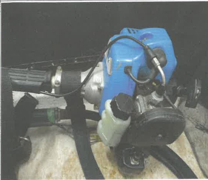
예초기 오일 캡 교체 및 작동 상태 점검