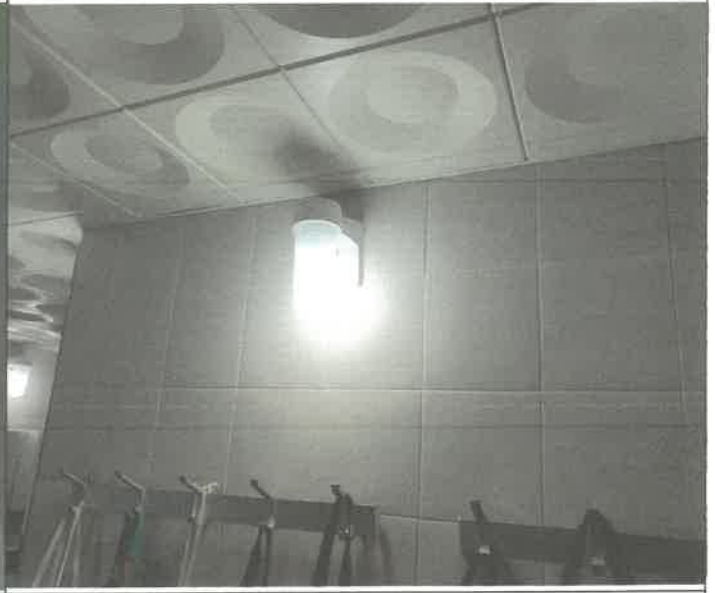
수영장 남자 샤워장 내 벽 등 1개소 전구 교체