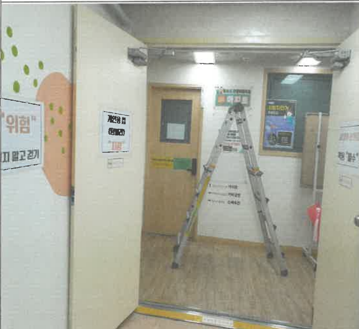
지하 1층 방화문 자동폐쇄 장치 도어 클로저 파손 1개소 교체