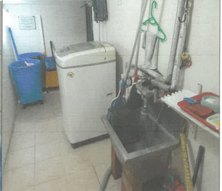
수영장 청소용 개수대 바닥 누수물 점검 조치 및 유도로 바닥 타일눈줄 구간 제거