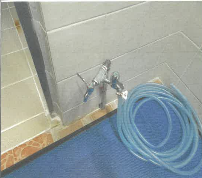
수영장 여자 샤워실 입구 세족장 수전 세족용 청소용 분리 추가 설치