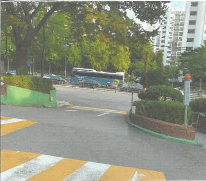
주차장 주차감지기 누전 1개소 보수