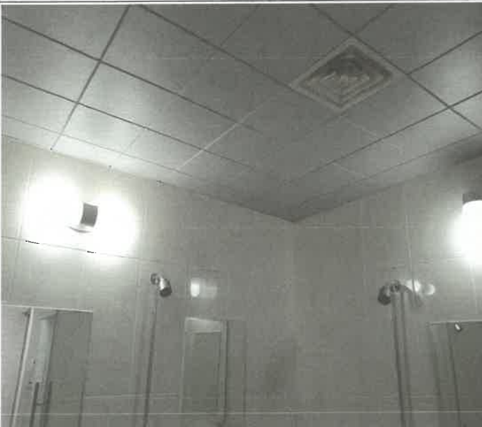
1층 대체육관 여자 샤워장 내 벽 등 2개소 전구 교체