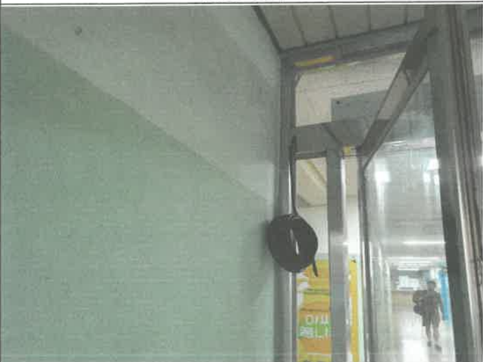
주차장 방카 복도 출입문쪽 전기 간선 작업