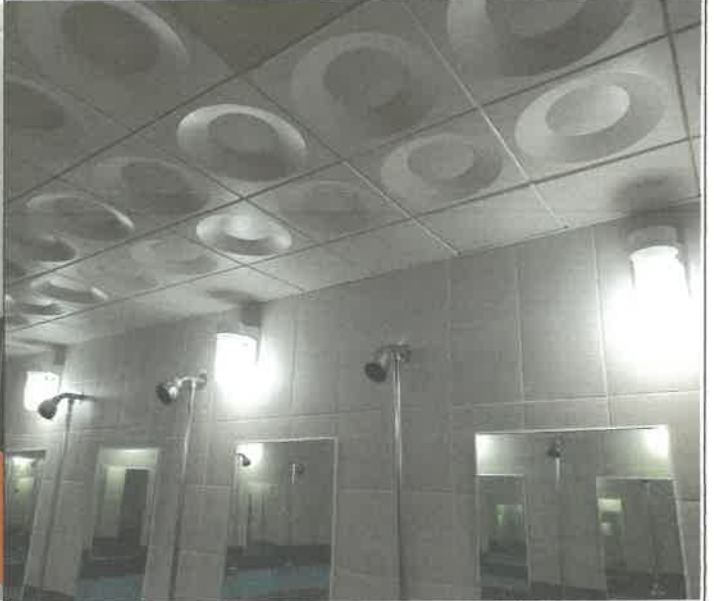
수영장 남자 샤워장 내 벽등 2개소 전구 교체