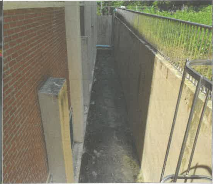
수영장 썬클실 낙엽제거