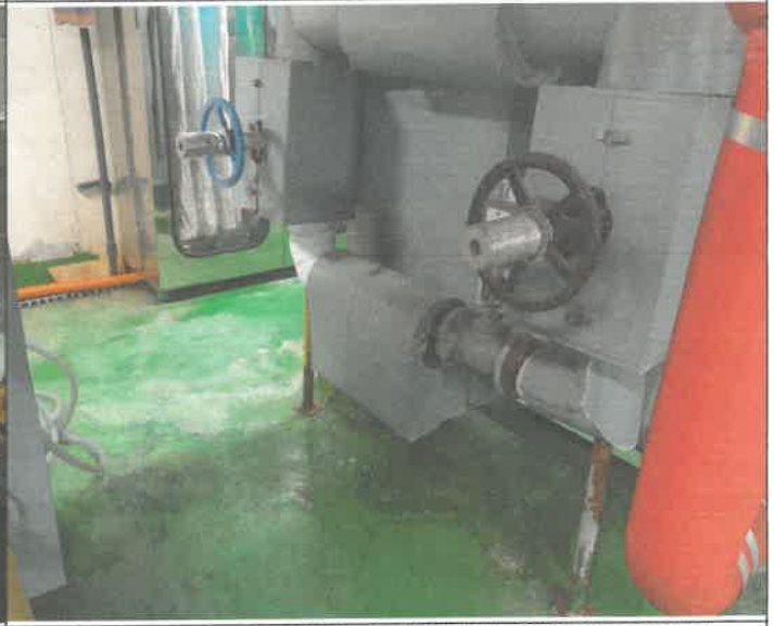
기계실 난방 열교환기 스트레이너 케이싱 도색 및 보온커버 시공