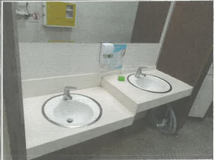
1층 남자 화장실 세면대 막힘 통수