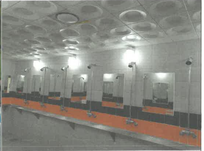
수영장 여자 샤워장 내 벽등 1개소 전구 교체