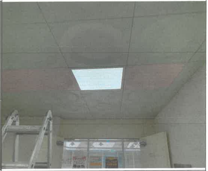
3층 중앙 복도 천장 사각 매립등 1개소 점등 불량 안전기 교체