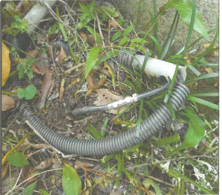
주차장 cctv 1개소 동축 케이블 단선 제 결선