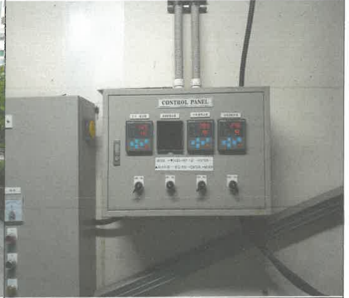
수영장 수온 온도 제 셋팅