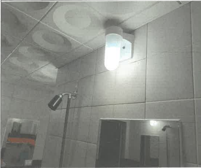
수영장 여자 샤워장 내 벽 등 1개소 전구 교체