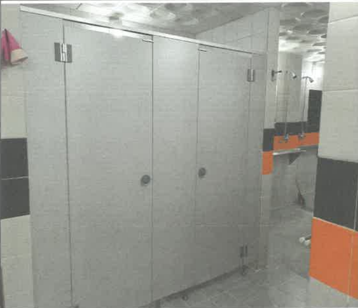
수영장 여자 샤워실 화장실 문짝 강화 코팅제 마감보수 설치