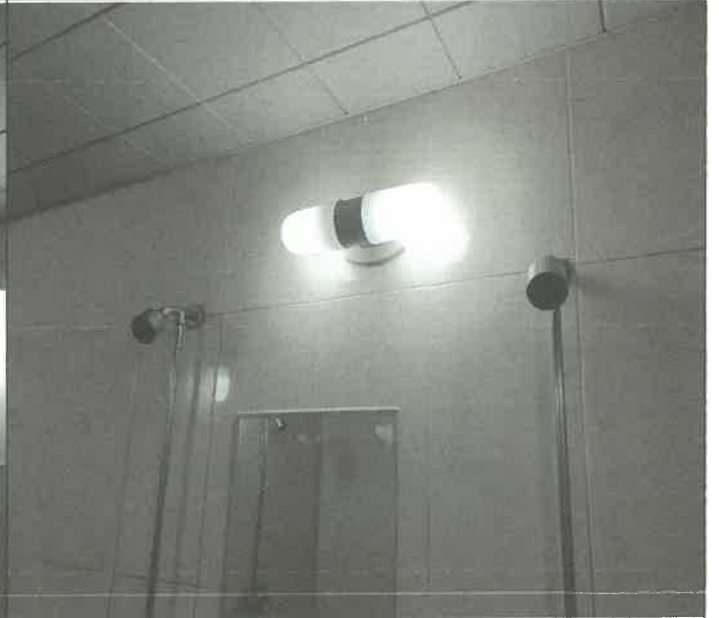
1층 대체육관 남자 샤워장 내 벽 등 1개소 전구 교체