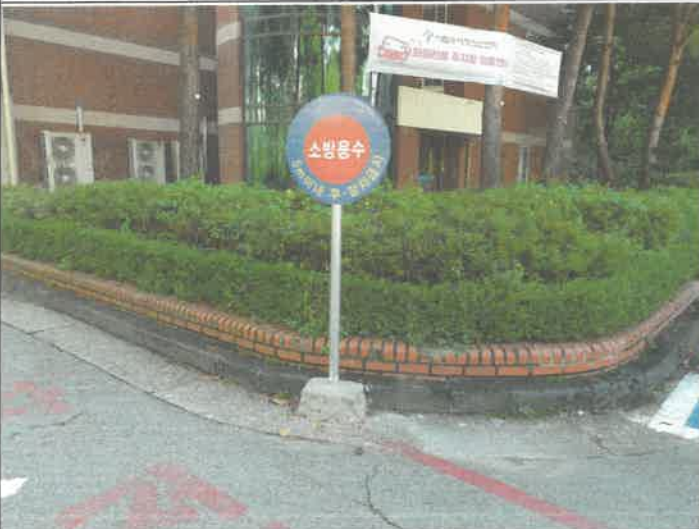
주차장 소방 용수 표지판 고정 설치