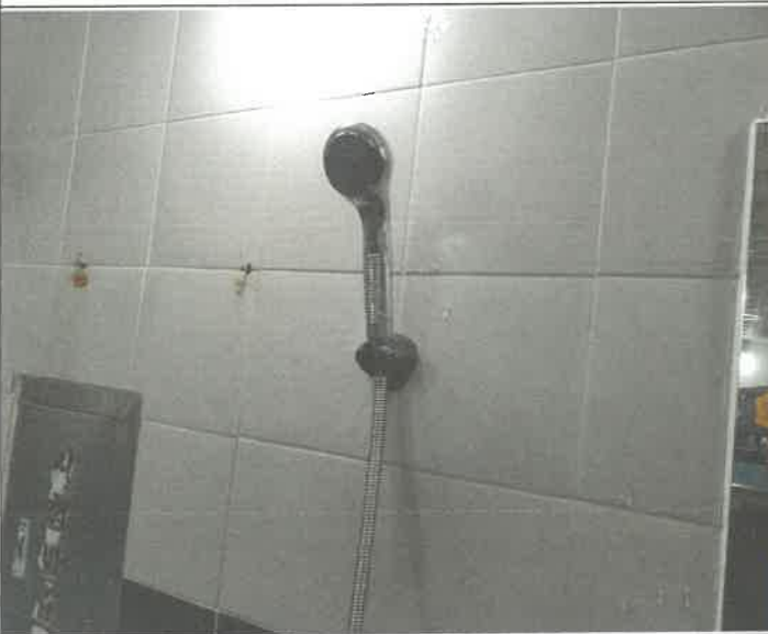
수영장 남자 샤워장 내 코브라 샤워기 헤드 파손 교체