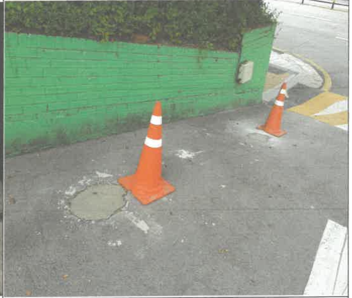
주차장 출입구 대리석 볼라드 파손 부위 바닥 시멘트 미장