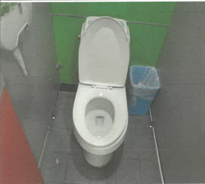
1층 여자 화장실 좌변기 막힘 통수