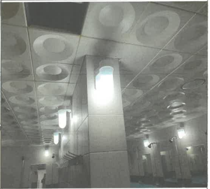
수영장 남자 샤워장 내 벽 등 1개소 전구 교체