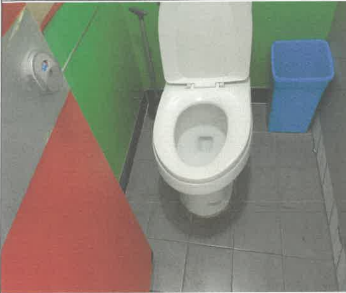
2층 여자 화장실 좌변기 막힘 통수