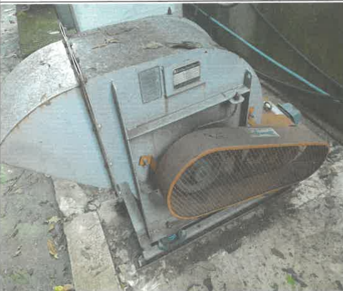
대 체육관 배기팬 V벨트교체