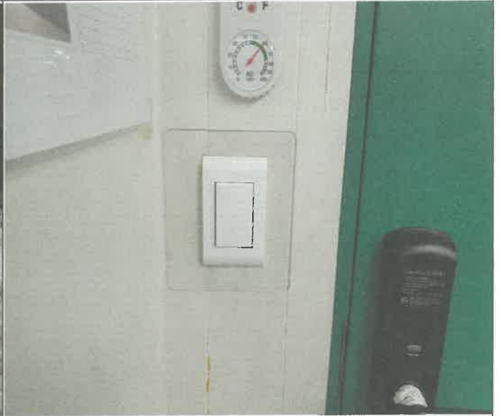
2층 (프)4실 전등 스위치 교체